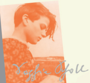
Plakat der aktuellen Wanderausstellung der Weiße Rose Stiftung